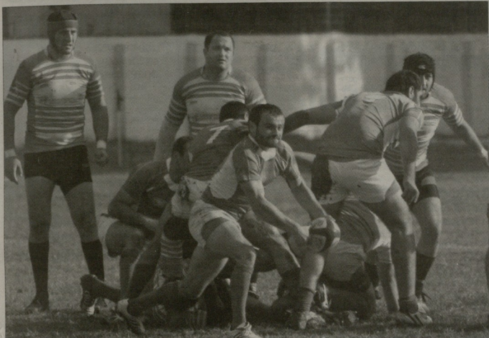
ბურთით გვირგვინ ზარდაცემული