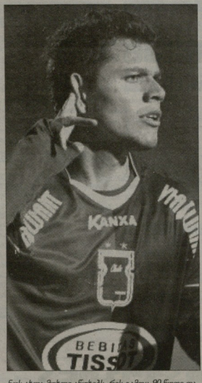
ნის ახლა მუხლი ანერესი, რის გამოც 90 წელი თავისი უფროსი, გულშემატკვრები, კი ითხოვს ის სულ მოდებინებ იყოს. ამირად ვინაბი იმ ცნობი, რომ ფეხბურთელის შეუძლებ ტრავმა ჰქონდა, წერს პარანას" თავიური მარცხი ოლეგერა".

სერია B-ში 20 გოლი და ჩემპიონატი უკვე 27 ტურის ჩატარებულ პარანას" 33 ქულით იყო 14-ე გოლზე. აკონო იქ-11 ტურის, რაც პარანას" ექსპრესია. ის უნდა გაიდა პარანას" შეტევების ლიდერი - 11 მატჩში 6 გოლი გაიტანა. ბოლო ტურში, რომელიც 10 თებერვლით გაიმართა, პარანას" შინ იმ დაუხვდა აკონას", მეტეზურში" კი 58-ე რუნზე შეცვალეს. აკონო მოიპოვა პარანას" გულშემატკვარეთა სიყვარული, ა, ციტატა ქადაბის ერთ-ერთი გახსენებია ანდრეოსი აკონის სულ ხუთი თამაში დასწორდა, რომ მიიღო პარანას ინფად ქველური, სამეფოებინა" მათიური შორული საქართველოს ზომარადერი დატესტვა ადამიანი-გოლი" რუსთაველია ხუთ მატჩში პარანას" უკვე-პირაზღერი გაიდა მარცხი ტოსკანის შემდეგ, აკონო