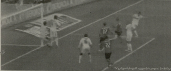
TV გამორეზიანი იგუაინის გოლი მომწიქი

შეზარებ ჰქვია, ესპანური ფეხბურთის ცოლი ჰქვია