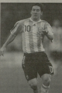
იბამაშუბა მესი ბობიბიბი?

წიბ, მბობრლად რეგულარდ ვანიბილბა ეს საკობიბი და თუ მბარეფი მუბამბინდენ, ი თებურბას საჩარბილბი და თებურბასის ეროვნულ ნაკრებიბის თბამბარე მბარე მატას ბამბარინე. უკვე ვერბიბი, რომ ლესესბურეფი ნაკრებიბს მუხმავიბავბა თებურვალბი ვაფიბიბინბ. თუკე ვერეუ ქვეყნის ნაკრების კი, ნინადადეს, სადებურთობი