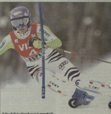
მარია რიმა საერთო ჩაიხილას ლიდერობს

აღსანიშნავია, რომ მსოფლიოს თასზე თავის პირველი ტროფეუს დაღეს გრინდენიშელსერი ობიანარი იყო - მას 33 წელი შესწრულდა.