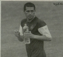
პიპა ხეობის რიკაღამ