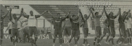
ფლუმინენს უკვე ზეიმის