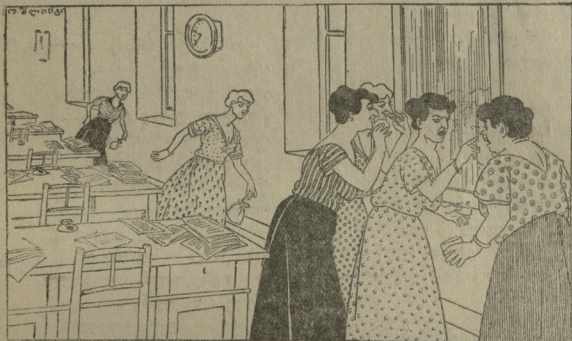
10-დან 11 საათამდე

შალს ევალდება: ორ შემდეგ ერთხელ მოვლდეს ფერმაშეცხვრე დაბანაკებულ ვითარებას დასწავლა-ცხე: ძროხა რომ მოკვდება, თუ შეხვდება ( ). ანკობოს ექმის, ექმის მოსვლისთანავე ვკვდარ ძროხას გაუტრას მუცელი და ამოუყაროს შიგანი, რომ ექმის ხელი არ დაესვალოს. (გატყვება და დამახება ამით არ ევალდება). წრიგულს ღილი შრომა გადახდათ. თითქმის ხუთამდე ძროხას ამოუყარეს შიგანი და გაუშვეს ტყლიბი, რის გამოც ექმის წლის განმავლობაში ხუთჯერ დასჭირა ფერმაში მოსვლა ატომობილით, რაც შეეგება ხზოების მოვლას. გულკეთილ ფერშალს ექმის არ შეუწყუბია, რაკი ხზოები სუტენტი იყო, მან სიკვდილამდე თვითონვე წასჭრა კისერი და გაუშინჯა ვეგო. ასეთი საეჭიბო დახმარების შემდეგ კიდევ თუ ვაგრძელდა დეფიციტის ავადმყოფობა, მაშინ ვადაწყვეტილი იმდენაა გააღიღონ ფერშის სახელზე მუშა-მოსამხატრება საერთო რიცხვი, რომ თითო მუშველ ძროხას ორი მოსამსახურე ჰყავდეს.