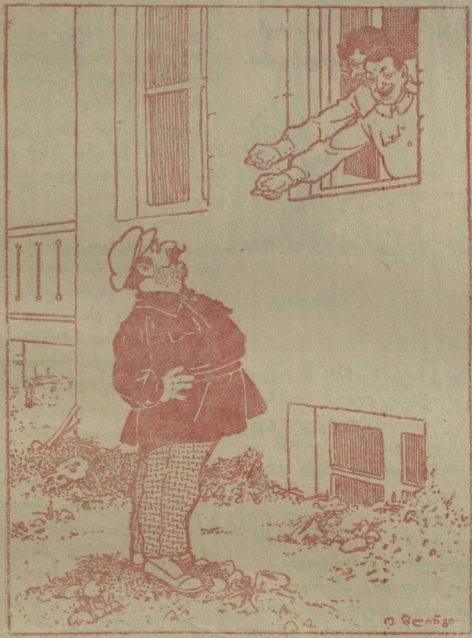
გულის საფხანად ამოსდის ჩუხულ-ქართული გინება

სიდაც ყოველ-ლამ თაგვები უჭიანუროდ ცეკვავენ და ახლო ტრამვისათვის, ფეხილებში გზები ვაჰყავენ. განარისხებული ისაკ ასკდება მღვმურთა კარებსა და რომეკრაფერს, განხდება გორაკისა დიხზარებასა.