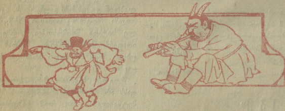
ჭიათურის განათლების განყოფილება.

ქალი. რას გეცხათო? მე მრცხენია თქვენთან ვარება, როგორ სკეთით ასე ფხვსაცემლებს? ვაი. უკაცრავად, მაგრამ მე ფხვბეს მიწის ვაბიჯებ. თქვენ კი, ალბად... პაერში დღფრანავით.