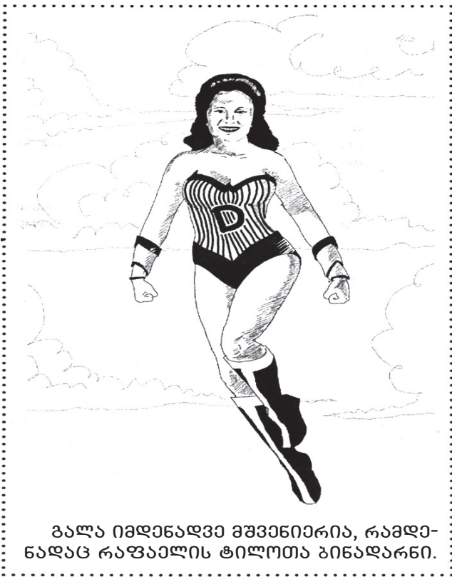
გალა იმდენადვე მშვენიერია, რამდენადაც რაფაელის ტილოთა ბინადარნი.

მოსატყვევებს რა გრძობათა ნატიფ სუნთქვას, პლასტიკა და გამომხატველობა ხორციელდება ხორცისა და სისხლის უზადო ხუროთმოძღვრებაში.