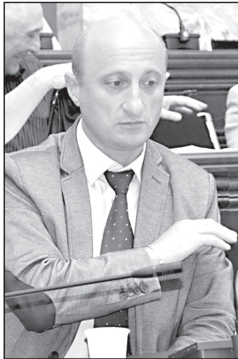
ხელისუფლებაზე გავლენა არ ექნება? საზოგადოებას ადეკვატური რეაქცია ექნება, თუკი ხელისუფლება ხალხის აზრს გაითვალისწინებს.

– დიახ. გავლენას მოახდენს, მაგრამ არ მინდა ვიხილო საქართველოში რალაც დესტრუქციული მოქმედებები, გადაკეტილი ქუჩები, წინააღმდეგობის მოძრაობები, რომელშიც ზოგი გულწრფელად მიიღებს მონაწილეობას, ზოგი ბოროტულად. არ მინდა ქვეყანა ბოროტი ძალების გამოყენების ასპარეზად იქცეს. ამიტომ ხელისუფლება უნდა იმოქმედოს აბსოლუტურად აქტიურად.