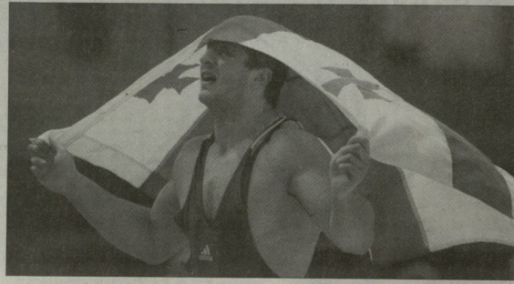
ფორტუნა რომ მწყობრივად მიტე უმაღლესი ტურული მეციქვლები...