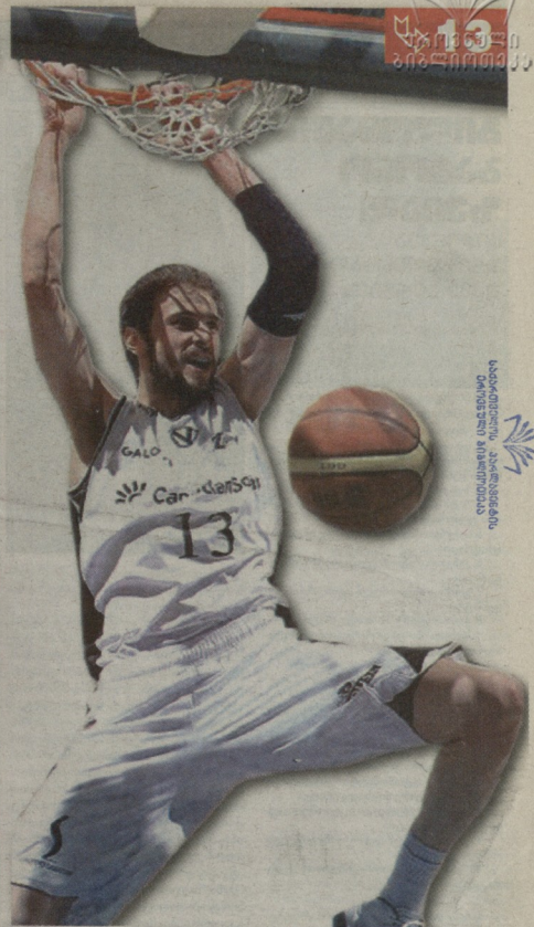
საბოლოო, კალანდარი დღეობის მიხედვით