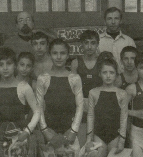
მამა-შვილი ველისამილიები თილისის პირველობის გამარჯვებულებიან და პირხოვერთან