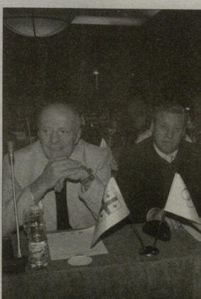
მარცხნიდან ოლიმპიური ჩემპიონები - ვაჟა კვიციანი...