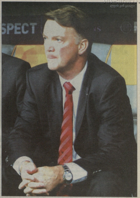
არის ფეხბურთელი, რომელიც საჭიროების შემთხვევაში გამოიყურება, - განაცხადა რუმენიგემ.