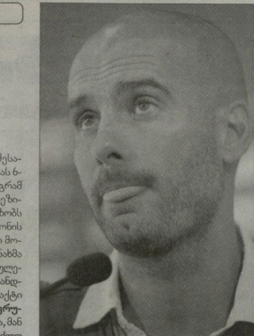
გვარილი ბარსისანი დღევანე ახალ კონტრაქტს გააგრძელებს

29. ანდრეი მორავა 18 01 1 1 0 0 0 0 0 0 0 0 0 0