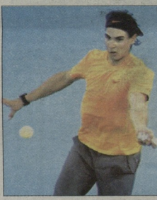
ნაღალა ათწლეული შიშო