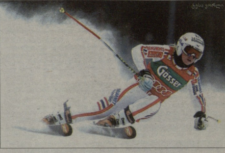
ფრანგული პეტი-სირაკის კონკურსში მონაწილეობის შესახებ