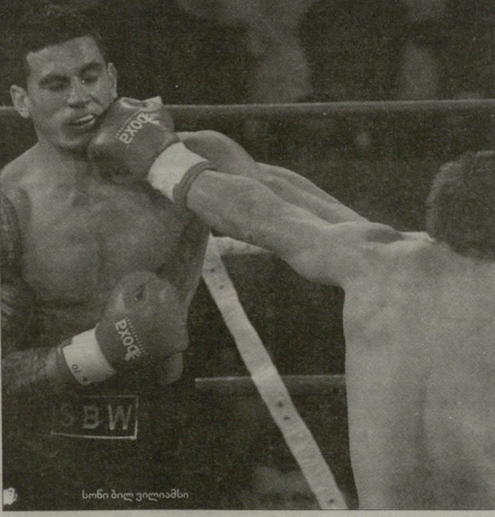
სონი ბილი ვილიამსი

ახალი ზელანდიის ნაკრების ვარეყმარ ბილი ვილიამსს მეტყეად აქვს გადაწყვეტილი, პროფესიული რაგბის დაუბრუნდეს არც, ცხადია, ის რაგბიდან წავიდას არ აპირებს და ზე რაგბის 2011 წლის გათამაშებამი "კრუსიდერსში" შემაგდელობაშიც შეუცვლილად თიამბებმა. სონი ბილის აპირება აქვს, "სოლე ბლეკსთან" ერთად შემოხლონაზე მოხელი თასიც მოიგოს. შეგახსენებთ, რომ სონი ბილი ვილიამსს აქამდე პროფესიულ რინგზე ორი ბრილია გაუმართავს და ორივეში გამარჯვება იწვიეს. მას ძალიან უნდა მესამედეც დაეცადოს ძალი და 29 იანვარს რინგზე სკოტ ლუისის დავიპირსპირდება. ცხადია, ვილიამსის გეგმებით ახალი ზელანდიის რაგბის კავშირი ადფორიანებული არაა, მაგრამ "სოლე ბლეკსის" ამომავალი ვარსკვლავი იტებარს მარკ არ იტებს. მინია, ყველას ვასკრობად ვიქვია, "სოლე ბლეკსის" შემადგენლობაში თამაშს არ უფრავს ყველაფრის რომ თავი დაეხებებოთ, ახალი ზელანდიის რაგბის კავშირთან კონტრაქტი მაქვს გაფორმებული. ძალიან მიინდა ზე რაგბის გათამაშებამი წარმატებული სეზონი ქმინდეს. გარმწიუნებთ, ყოველივე ამამი კრივი ხელს არ შემიშლის. ცხადია, რინგზე ასედა და კრიკთან მათი სითანა დაკავშირებულია, მაგრამ ცხოვრებამი წარმატება რისთვის ვანების ვარეყმ არ ნანობს. კრიკმა ძალიან ვამიტყვა, მან ხასითოვა გამომიშევა და ვგრძნობ, რომ სპორტში ამ სხეობაშიც ბეჭვის მიღწევა შემიძლია.