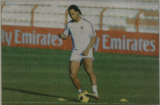
რონალდინო გუმბიდელ ვარჯიშზე