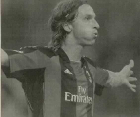
ინარი ერთი საუკუნის

სერია A-ს მიმდინარე გათამაშება 6 ინარს გა- ხანლებს, რქამდე კი ვეცდები დრო, განვლილი ბატვა- ლები მევაგამოთ. ანალიზის საინაჩაღდგეო რა უნდა გვეჩვენოს, მით უმეტეს, იტალიაში ძალიან უცვარი ფეხბურთე სავაბრი, მადარი ვეცერობით, რომ არსებულ ვითარებას ვეცლა უკეთ სტატისტი- კა გადმოვცემს. დიხ, სტატისტიკა არანადროს მეტრის და ვეცდები საშუალება განვხილო 17 ტური როცხეუბნი ავსიათი.