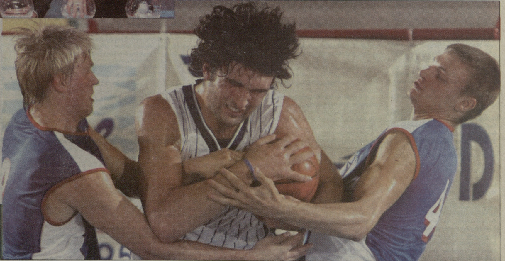
2004 წელი. საქართველო-რუსეთი 87:71