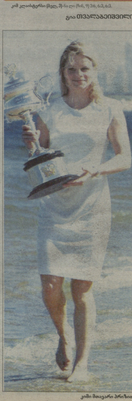
კიმი მთავარი პრიზი

კაცებისგან განსხვავებით, ქალებს შორის ფინალმა გაამართლა გულშემატკივართა მოლოდინი. არადა, იყო ვარაუდი იმის შესახებ, რომ გამოცდილი კიმ კლაისტერსი იოლად მოუგებდა ჩინელ ნალის. ბელგიელი მერვედ თამაშობდა „დიდი სლემის“ ტურნირის ფინალში, იმ დროს, როცა ლის პირველად უწევდა ასეთ დონეზე გამოსვლა. თუმცა ჩინელს ერთ თვეში 29 წელი უსრულდება და მისი მხრიდან გამოუცდელობაზე ლაპარაკი ზედმეტი იყო. ნალიმ 2010 წლის ავსტრალიის ღიაზეც შესანიშნავად ითამაშა - ნახევარფინალამდე მიადგინა და იქ სერენა უილიამსთან წააგო. წელს აზიელს ამავე სტადიაზე ისევ პირველ ჩოგანთან მოუხდა თამაში და ამჯერად გაუმართლა - ვოზნიაცკიზე გაცილებით უკეთ გამოიყურებოდა.