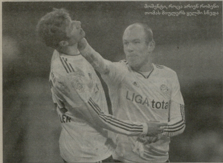
მომგები, როცა არიენ რობენი თომას მიულერს ყელში სწვდა