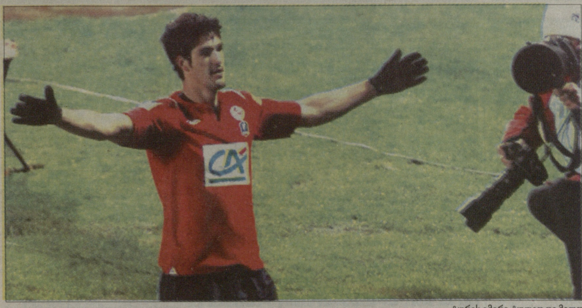
ტურის გმირი ტულიო დე მელო