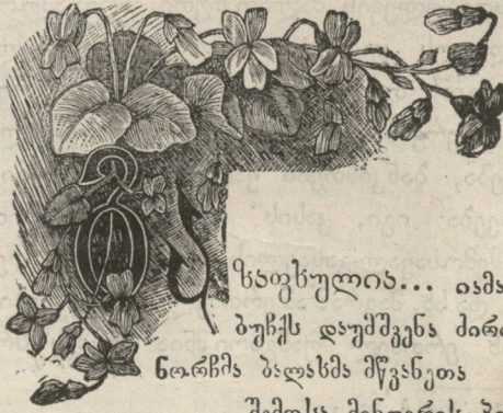
საბუხულია... იამა ბუჩქს დაუშეკნა ძირია, ნარჩხა ბაღსსა მწვანეთა შემოსა მინდვრის პირია.