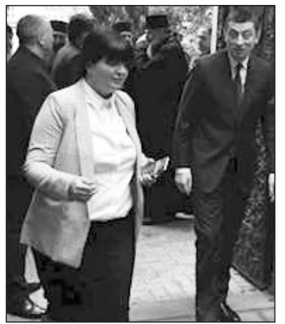
პარლამენტიდან კანაფის კულტივაციის შესახებ კანონპროექტს უკან

გაიჭვივებენ. ამის შესახებ ცნობილი პარტიარქთან შეხვედრის შემდეგ გახდა. განცხადება კი პარლამენტის თავმჯდომარე ირაკლი კობახიძემ გააკეთა. ირაკლი კობახიძე შინაგან საქმეთა მინისტრ ვიორგი გახარიასთან ერთად დღეს საპარტიარქოში იმყოფებოდა, სადაც საქართველოს პარტიარქს, ილია მეორეს შეხვდა. კანაფის კულტივაციის შესახებ კანონპროექტის განხილვა პარლამენტში შეჩერებული იყო. საკანონმდებლო ორგანო მხოლოდ მარინუანის მოხმარების შესახებ რეგულაციებთან დაკავშირებულ კანონპროექტს განიხილავდა.