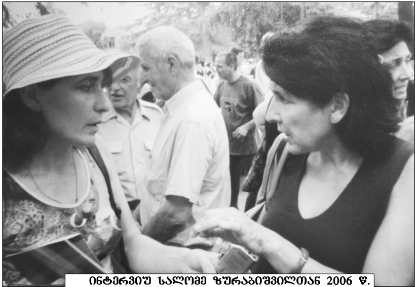
ინტერვიუ სალომე ზურაბიშვილიან 2006 წ.

დრო გირგვლიანი და სიმარტოლის ძიებაში გარდაცვლილი დედა ირინა ენუქიძე, ციხის კადრები და „კარების“ საქმე მცირე ჩამონათვალა იმ დანაშაულებრივი ქმედებებიდან, რასაც 9 წლის განმავლობაში ახორციელებდა „ნაციონალიზმის“ ხელისუფლება საქართველოში. დღესაც თვალწინ მდგას 2012 წლის 19 აგვისტოს, ბახმაროს შესასვლელში ეწ. „სამეგრელოს სპეცნაზისაგან“ დაკავებული 70-მდე გოგობიჭი, რომელთა დანაშაული მხოლოდ ის იყო, რომ „ქართულ ოცნებას“ უჭერდნენ მხარს და ოცნების ლოგოიანი მაისურები ეცვათ. მათ ჩემი ოჯახის წევრებიც დააკავეს, რომელთა შორის 2 არასრულწლოვანი იყო.