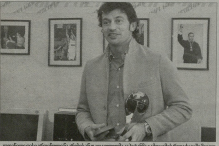
ყოველთვიური 100-ლარიანი სტიპენდიის გველ უკეთი გამოკითხვიმ მე-2 და მე-3 ადგილებზე გასული დღეით ოთარეშაძის (474 ხმა) და ვაჟა მადლობა (168 ხმა) პირველ დამირიბებლებს - ავთანდელ ნადირაშვილებსა და ვაჩა მახარაძეს.