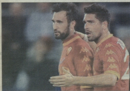
მარკოს და მარკოს ტანდემი ტურნირში აღდგება

„აუვერტუსის“ მესვეურების რომელიც კოლექციების ურთიერთობის ბორილოს დარღვევით არ ასრულებენ და სურთ, ტრანსფერის პისაროც გადაიხირონ. ამის შესახებ იტალიური სპორტული პრესასთან თვითი აუვერტუსი განაცხადს,