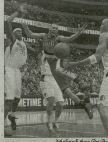
ბრუნდები რომ (20:19)