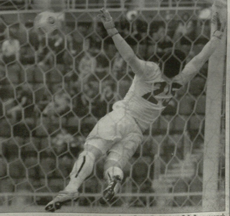
კოკა სეფიაშვილი შეიძლება დინამოში გადავიდეს