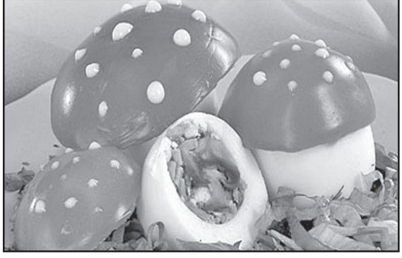
სელენის მდიდარ წყაროებად ითვლება კვების პროდუქტები: ღვინო, ზღვის პროდუქტები და ზღვის თევზი, კვერცხის გული, სოკო, სიმინდი და ბრაზილიური კაკალი.

სელენის (ქიმიური ელემენტი) უკმარისობა აჩქარებს ორგანიზმის დაბერების პროცესს, დაადასტურეს გერმანელმა მეცნიერებმა. მათ დაადგინეს: სისხლში არსებული სელენოპროტეინის ცილა, რომელიც საკვებისგან სელენის ათვისებაზე პასუხისმგებელია, შეიძლება სხვა ცილების გამოუმუშავება გადაამსყვეტი ფაქტორი იყოს. ეს უკანასკნელები უზრუნველყოფენ ორგანიზმის დაცვას თავისუფალი რადიკალებისგან. აი რატომ, რომ სელენოპროტეინის უკმარისობა უმაღლეს ზრდის ონკოლოგიურ დაავადებათა განვითარების რისკს ასევე თავისუფალი რადიკალებისგან დაუცველ ორგანიზმში აქტიურდება ორგანიზმისა და ქსოვილების ელვისებური დაბერების პროცესები.