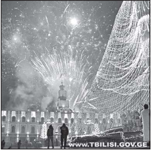
საშობაო ტრადიციები, რომელიც ადრე იწყებოდა, როგორც მემორიის რეპერტორიაში მისი მხარდობის დასაწყისი ნობელიანტი მისი მხარდობის დასაწყისი...

ფიქროვან, რომ გლინტვიინი პირველად სანდონივიურ ქვიშებზე გაჩნდა. იანვარი მცხოვრებლები, სიტყვისგან თავდაპირველად, უზღუდრვი ღვინის გათვრით ექსპერიმენტებს მიეწევიან, თუმცა ისტორიკოსები აღნიშნავენ, რომ გლინტვიინის პირველადი კველ რომაელებთან უნდა ვეძებოთ, სწორედ ამ მომენტის სახელით სხვადასხვა სახელმწიფოს დასახლებულნი იყვნენ, ღვინის ფორმისა და მინდის დამატების პრინციპი დაწინაურებულია ადრეინი ბურგან აპიტის კველრომული რეცეპტების ნივრთი.