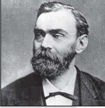
გიორგი მთავრი, რომელიც 1901 წლის 10 დეკემბერს, ალფრედ ნობელის გარდაცვალების წუთი წლისთავზე, მსოფლიოში ყველაზე საპატიო სამეცნიერო ჯილდოს მფლობელთა შორის მეთერთმეტე საბავარიის დიდიპრინცი და ფილიპინის დედოფალი...