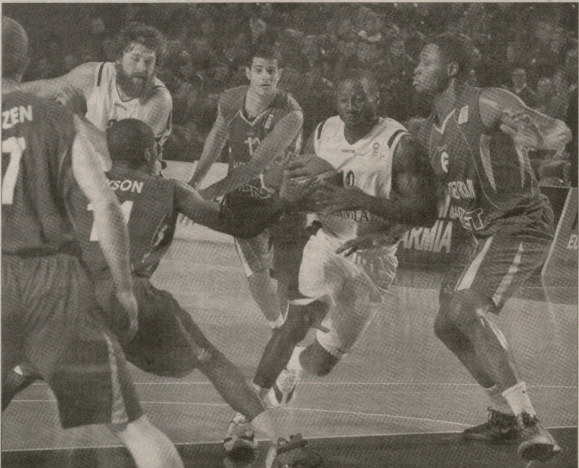
კურტის მილიეჯმა მასპინძელთაგან ყველაზე მეტი, 23 ქულა ჩააგდო

ლო. ქართველებმა ამ კომპონენტზე ბევრი იმუშავეს, მეტოქის გამამაშებელს არმიელი უკანაზველი მოედნის მისავე ნახევრიდან ავიწროებდა. ქართველები ერთმანეთს კარგად აზღვედნენ და მათი კალათისკენ თავისუფალი დერეფანი იშვიათად ჩნდებოდა. სწორედ ამის შედეგი იყო, რომ „ჰაპოლმა“ სანყის 7 წუთში თამაშიდან ბურთი ვერ ჩააგდო, ხოლო 40 წუთის განმავლობაში სწრაფი გარღვევით მხოლოდ 2 ქულა მოინაგრა. პირველ ნახევარში სტუმრები ჯერომ დაისონის იმედად იყვნენ, რომელმაც დიდ შესვენებამდე 16 ქულა მიითვალა, ხოლო მატჩი 31-ით დაასრულა. ამერიკელმა საოცარი სიზუსტით ისროლა სამქულიანები: 12-დან 7 გამოიყენა (58.3%).