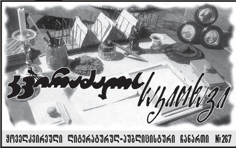
ყოველკვირული ლიტერატურულ-კულტურული ჩანაწერი №267