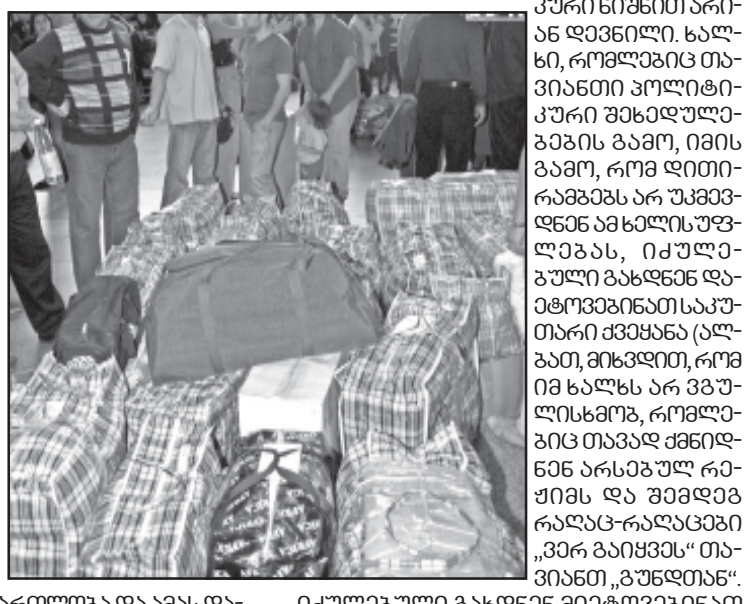
მოქალაქეები რაიონული ადმინისტრაციის განყოფილებაში...