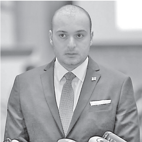
საპარტიო და ქართულ დემოკრატიაში თვითმმართველობას ყოველთვის განსაკუთრებული როლი ჰქონდა და განსაკუთრებულია, რომ დღევან-

დელი ჩვენი ხედვა სრულ თანხედრებაში ჩვენი წინაპრების ხედვასთან, პირველ რესპუბლიკასთან თუ როგორ სურდათ მათ საქართველოში ადგილობრივი თვითმმართველობის განვითარება, - ამის შესახებ საქართველოს პრემიერ-მინისტრმა მამუკა ბახტაძემ სახელმწიფო და ადგილობრივი ხელისუფლების ინსტიტუციური დიალოგის გენერალურ ფორუმზე სიტყვით გამოსვლისას განაცხადა.