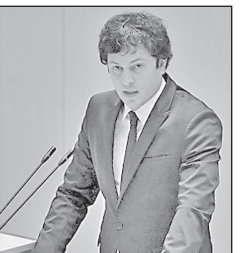
მეტი უფლებამოსილების და მეტი რესურსების გადაცემას, - აღნიშნა ირაკლი კობახიძემ.

მისივე თქმით, მნიშვნელოვანია გადაიდგას პრაქტიკული ნაბიჯები იმისათვის, რომ ადგილობრივი თვითმმართველობის სისტემა განვითარდეს. „ამისათვის არის საჭირო მკაფიო ხედვის არსებობა, დეცენტრალიზაციის სტრატეგიის არსებობა და მოხარული ვარ, რომ ამ საკითხზე აქტიურად მუშაობს მთავრობა, რეგიონული განვითარებისა და ინფრასტრუქტურის სამინისტრო. პარლამენტი კიდევ ერთხელ ადასტურებს მზადყოფნას, აქტიურად იყოს ჩართული ამ პროცესში. უმთავრესი ამოცანა უნდა იყოს დეცენტრალიზაციის განხორციელება, რაც გულისხმობს ადგილობრივი თვითმმართველობებისთვის