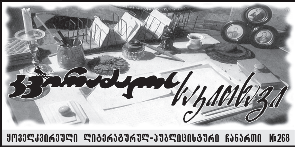
ყოველკვირული ლიტერატურულ-კულტურული ჩანაწერი №268