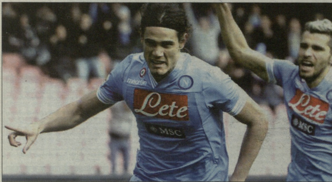
დენის კავანი 8-მატრიანი მწარლ სირია შეჯიბრ