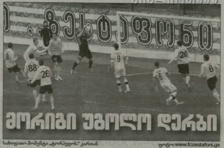
სახლითო მიმდგერ "გორვლის" კარიანი

17.03. ხასტავრონი, დ. პაპიაძე 3000 მაჩარავალი