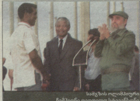
სამგზის ოლიმპიური ჩემპიონი თეოფილო სტივენსონი

კუბის მთავრობამ გააუქმა აკრძალვა პროფესიულ კრივზე, რომელიც კუნძულზე 51 წლის განმავლობაში მოქმედებდა. ამის შესახებ იტყობინება სააგენტო AP.