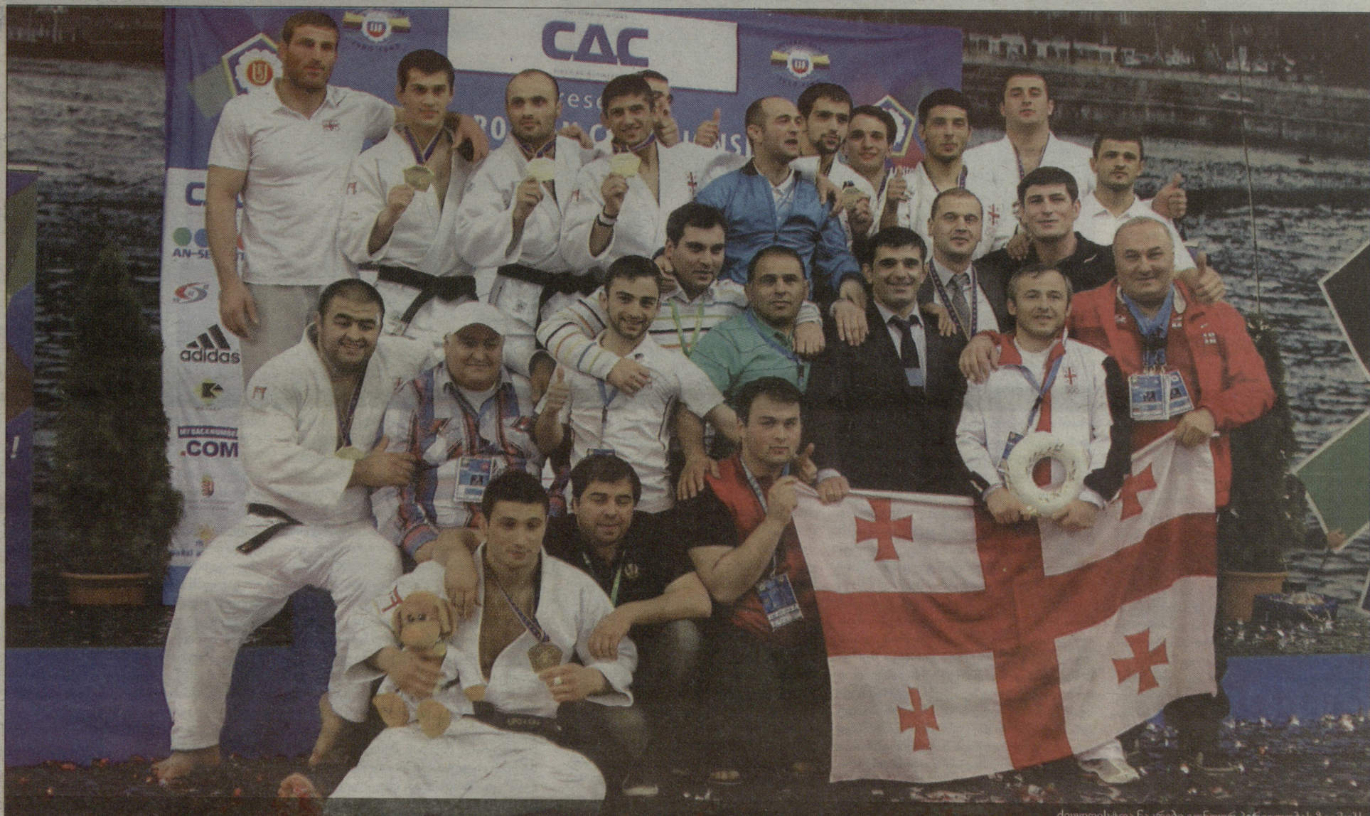
ძიუდოსტა ნაკრები ვუნდურ პირველობას ზეიმობს