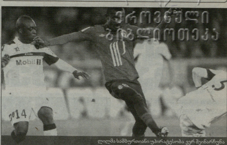
ლილა სამპურთიანი უპირატესობა ვერ შეინარჩუნა