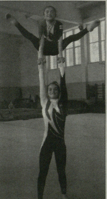
საქართველოს აკრობატიკის ფედერაციის სპორტულ აკრობატიკაში დიდ საერთაშორისო ტურნირს უმასპინძლებს. იმ