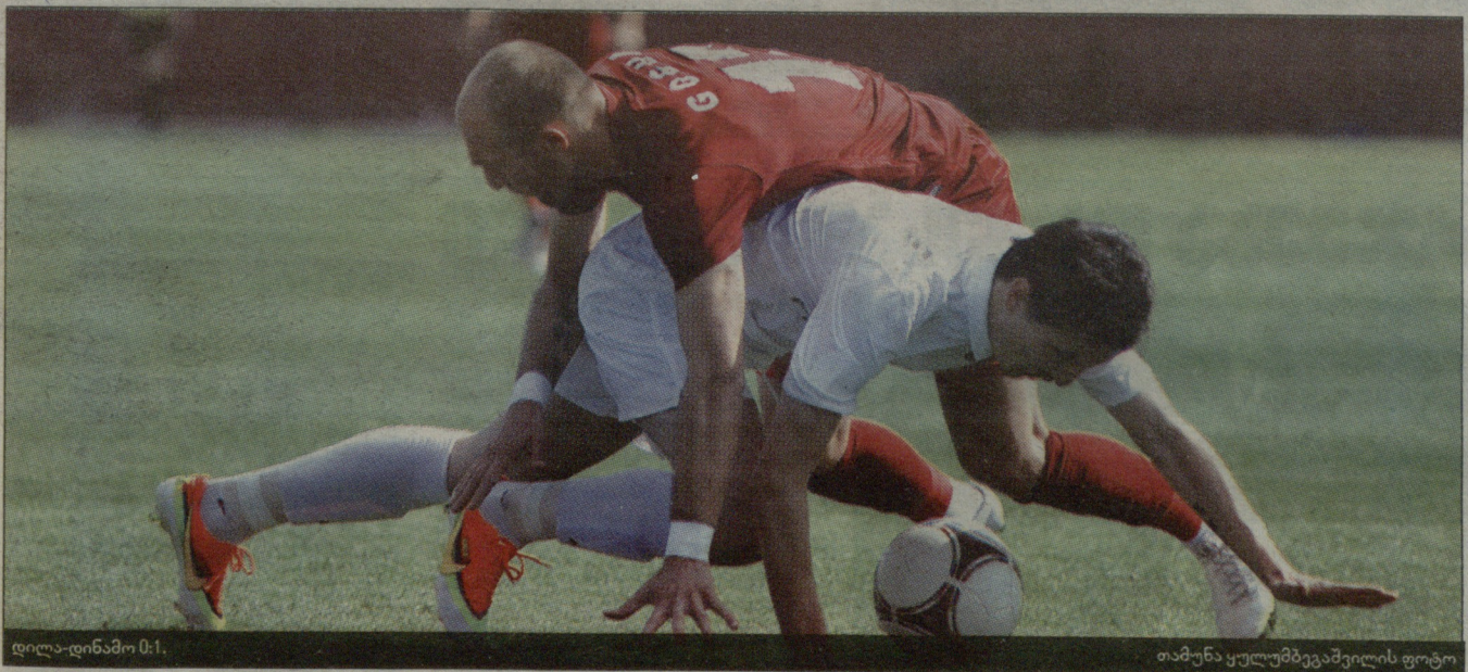
დილა-დინამო 0:1.