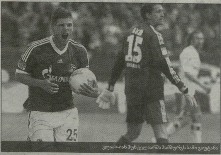
კლას-იან ჰუნტელარმა ჰამბურგს სამი გაუტანა