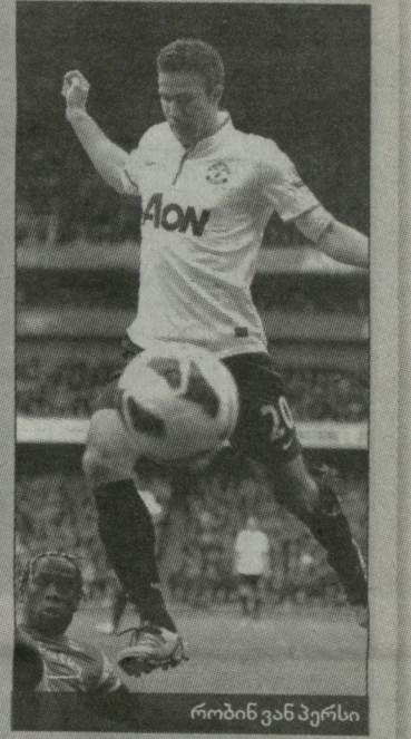
რობინ ვან პერსი

კვირას, „ემირატსზე“ „არსენალთან“ გატანილი პენალტი რობინ ვან პერსისთვის 25-ე გამოდგა ჩემპიონატში, რაც „იუნაიტედის“ დებიუტანტი თავდამსხმელებისთვის ყველა დროის საუკეთესო შედეგია. ჰოლანდიელმა ბრაიან მაკლერის მიერ 1987/88 წლების სეზონში დამყარებული რეკორდი 1 გოლით გააუმჯობესა. 23-23 ბურთი იყო თავის დროზე დენის ლოუსა (1962/63) და რუდ ვან ნისტელროის (2001/02) ანგარიშზე. სადებიუტო სეზონში ყველა ტურნირში გატანილი ბურთების რეკორდი (36 გოლი) სწორედ ამ უკანასკნელს ეკუთვნის, თუმცა თანამემამულის შედეგთან მიხედვით ვან პერსის ძალიან გაუჭირდება. ჩემპიონატის გარდა მას ჩემპიონთა ლიგაში 3, ხოლო ასოციაციის თასზე 1 ბურთი აქვს გატანილი და პრემიერლიგის დარჩენილ 3 ტურში 6-ჯერ მართებს თავის გამორჩენა.