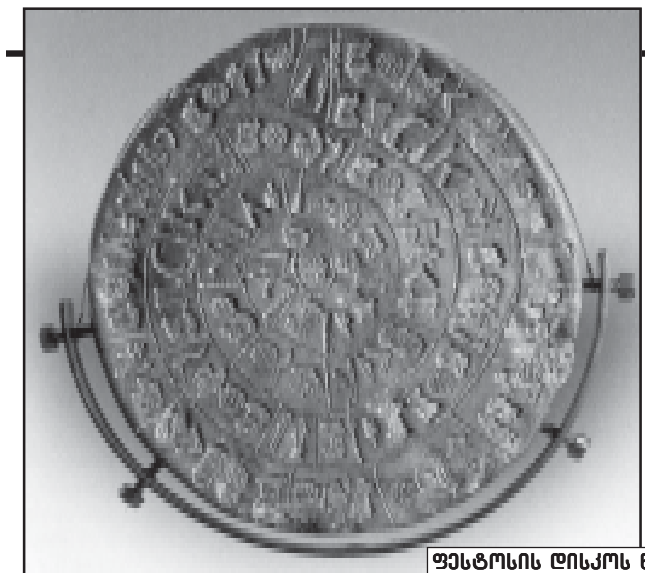
ფესტოსის დისკოს წინა და უკანა მხარე