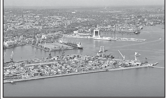
ნის კარაჩიში და ინდოეთის მუმბაიში, სოლო ყველაზე პატრიციაში ქალაქი ლონდონი ყოფილა, რაც განიცდებდნენ დიდად გასაპვირი არ უნდა იყო.

2009 წელს რუსეთი ამოვარდა ფუფუნების საგანთა მოხმარებაში ძველგაბრძნის პირველი ათეულიდან, მაგრამ შარხან წლის მიორე ნახევარში ლუქსის კლასის პროდუქციის გაყიდვებმა ერთხელაც 12 პროცენტით მოიმატა. თუმცა ისიცაა, რომ აზროლულური მარკეტინგით ჩინეთი (ტაივანის გარეშე ყველას უხრავს, სადაც ყოველწლიურად 12,9 მილიარდი ევროს ღირებულების ფუფუნების საგანები იყიდება. რუსეთში კი ახლამე პერიოდში გოლოდ 5 მილიარდი ევროს ლუქსის კლასის სამონელი იყიდება. ასე რომ, ეცემა რუბლი თუ ინევეს, თაქვად განსაჯეთ, ბატონებო!