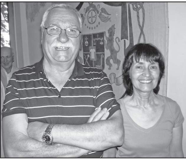
როგორც ჩანს, მიუხედავად ყველაფრისა, მართლაც ჩვენი სამშობლოსკენ ღტოვბა, თუნდაც ძველ ნიკოებთან...