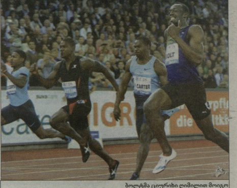
ბოლტმა ციურისი ღლიძლი მოიგო

მან წელს კვლავ სტარტი მოიგო, რასაც მსოფლიოს ჩემპიონატზე გამარჯვებაც ეტება.