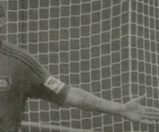
ლევირაკუზის გუნდი სეზონში და მატჩებს კისრები მესანიშნავ ფორმაში არის