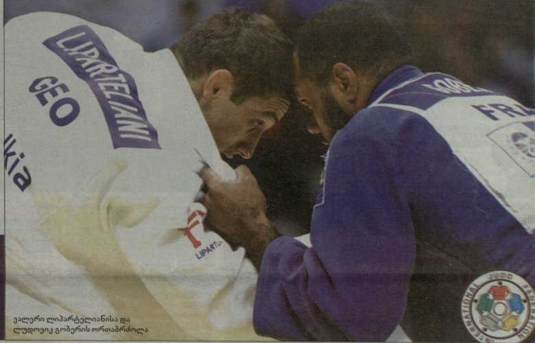
ვალერი ლიბარტელისა და ლუდოვიკ გობერის ორთაბრძოლა