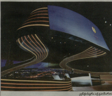
კენჭისყრა აბ გამართა