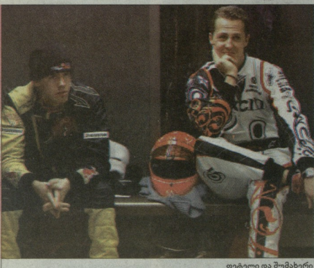
ვეტელი და მუმბახვილი