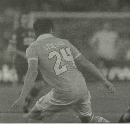
იტალიის სუპერთასის პაქეორებში "ოვერეტუსმა" "ლაციოს" გადაურჩინა

უღალა, ეს ჩემპიონთა ლიგაზე ასე-სიანი პაქეორებში გამოიხატება. კვირის "მილანი" "ალბარის" უმასპინძლებს და კვლავაც ახალგაზრდული ტრითი მუშუტებს სტეფანო მარაგის, მარიო ბალეტელის და მიაიკი ნინგის მუშაბეცნობით. საჭიროების შემთხვევაში, თამაში რომინო ჩაერევა, ალესანდრო მატრის