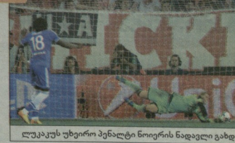
ლუკას უხეირო პენალტი ნიორის ნაღველი გახდა