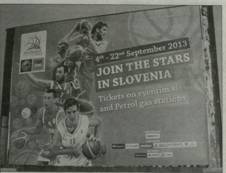
ბანერი რკინიგზის სადგურში

ჩვენი ზარკების ყოფილი 10-ნომრის, ზონინირ ბობანის რესტორანია, აქ სორვატის ელტე იკობებო.