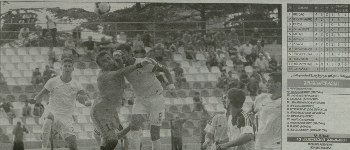
სახვითო მომენტები გურის კარიან