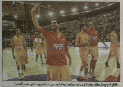
ესპანეთი: ერთადერთი დუმარცხებელი ნაკრები ამსანაფურცში

საფრანგეთი - 7 მოგება/3 ნაგება ბელგია - 5 მოგება/7 ნაგება უკრაინა - 3 მოგება/5 ნაგება ისრაელი - 3 მოგება/5 ნაგება გერმანია - 3 მოგება/7 ნაგება რუსეთი - 2 მოგება/7 ნაგება ლიტვა - 11 მოგება/1 ნაგება სერბეთი - 9 მოგება/3 ნაგება მაკედონია - 5 მოგება/5 ნაგება ლატვია - 4 მოგება/4 ნაგება ჩერნოგორია - 3 მოგება/3 ნაგება ბოსნია - 3 მოგება/7 ნაგება