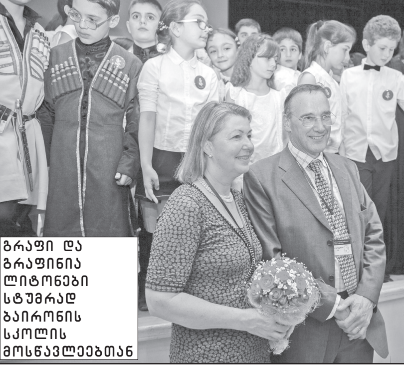
ბრაფი და ბრაფინია ლიტონეხი სტუმრად ბაირონის სკოლის მოსწავლეებთან

2005-09 წლებში ივ. ჯავახიშვილის სახელობის თბილისის სახელმწიფო უნივერსიტეტის ჰუმანიტარულ მეცნიერებათა ფაკულტეტზე პროფესორი ინესა მერაბიშვილი აფუძნებს სამაგისტრო პროგრამას „თარგმანი და კულტურათაშორისი ურთიერთობები“ (ქართული და ინგლისური ენების ბაზაზე) და სადოქტორო პროგრამას „თარგმანმცოდნეობა“, რომელთაც დღემდე თავად ხელმძღვანელობს. 2011-12 წლებში იგი სათავეში ედგა თარგმანისა და ლიტერატურულ ურთიერთობათა ინსტიტუტს, ხოლო 2012 წლიდან დღემდე არის თავისივე დაარსებული თარგმანმცოდნეობის კათედრის ხელმძღვანელი დასავლეთეუროპული ენებისა და ლიტერატურის სასწავლო-სამეცნიერთო ინსტიტუტში. მისი ხელმძღვანელობით დატულია არაერთი სადოქტორო დისერტაცია.