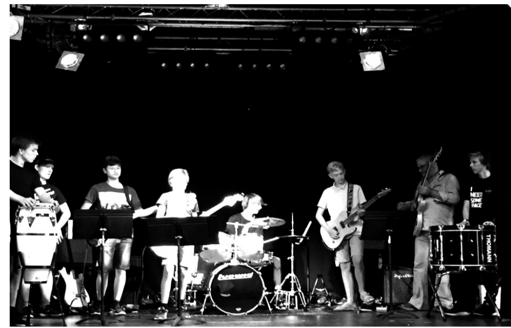
დანის მუსიკალური სკოლის მოსწავლეებთან ერთად.

- დიახ, ვსწავლობდი კონსერვატორიაში, მაგრამ ძალიან ბევრი გაცდენები მქონდა, 60 გაცდენაზე გარიცხვა იყო უკვე და მე გადავაჭარბე გაცდენებს. თვეობით მივიდიოდი გასტროლებზე. ერთ დღესაც, დეკანი მოვიდა ჩემი გაცდენებით შეწუხებული და მითხრა,