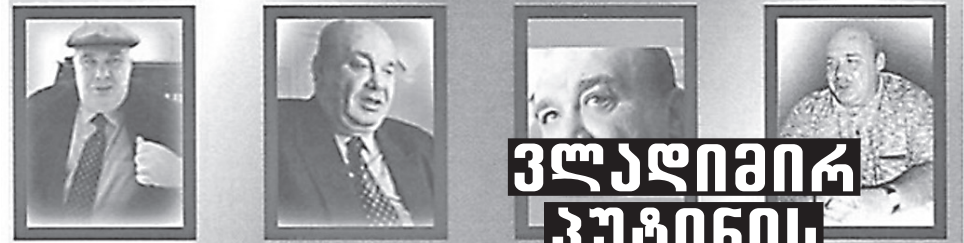
Photographs taken in 2001

Ten Most Wanted Fugitive #494: Mogilevich is wanted for his alleged participation in a multimillion dollar scheme to defraud thousands of investors in the stock of a public company incorporated in Canada, but headquartered in Newtown, Pennsylv