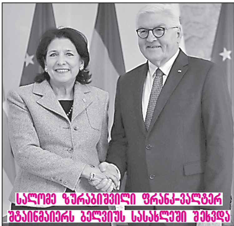
სალომე ზურაბიშვილი ფრანკ-ვალტერ შტიინმაიერს ბელგიუს სასახლეში შეხვდა

საპარტიო პოლიტიკის პრეზიდენტი სალომე ზურაბიშვილი, რომელიც გერმანიის ფედერაციულ რესპუბლიკაში ოფიციალური ვიზიტით იმყოფება, გერმანიის ფედერალურ პრეზიდენტ ფრანკ-ვალტერ შტიინმაიერს ბელგიუს სასახლეში შეხვდა. პრეზიდენტის ადმინისტრაციის ცნობით, შეხვედრებზე, რომლებიც ბელგიუს სასახლეში პირისპირ და გაფართოებულ ფორმატში გაიმართა, მხარეებმა საქართველო-გერმანიის ორმხრივი ურთიერთობები და საქართველოს ევროპული მისწრაფები განიხილეს. აღინიშნა გერმანიის განსაკუთრებული როლი საქართველოს ევროკავშირში ინტეგრაციის პროცესში. როგორც სალომე ზურაბიშვილმა შეხვედრებზე განაცხადა, მნიშვნელოვანია, რომ საქართველოს ევროპის გულში, გერმანიის სახით, ასეთი ერთგული მეგობარი ჰყავდეს. „გერმანია და საფრანგეთი არიან ის ქვეყნები, რომლებიც საქართველოს ხელს შეუწყობენ იმაში, რომ ჩვენი ქვეყანა მალე გახდეს ევროპული ოჯახის სრულფასოვანი წევრი“, – განაცხადა სალომე ზურაბიშვილმა. საქართველოს პრეზიდენტმა იმედი გამოთქვა, რომ საქართველო-გერმანიის ურთი-