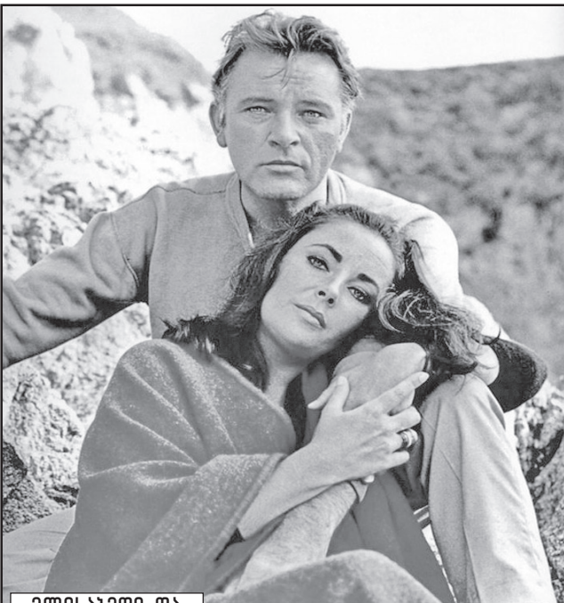
ელისაბედი და რიჩარდ ბარტონი