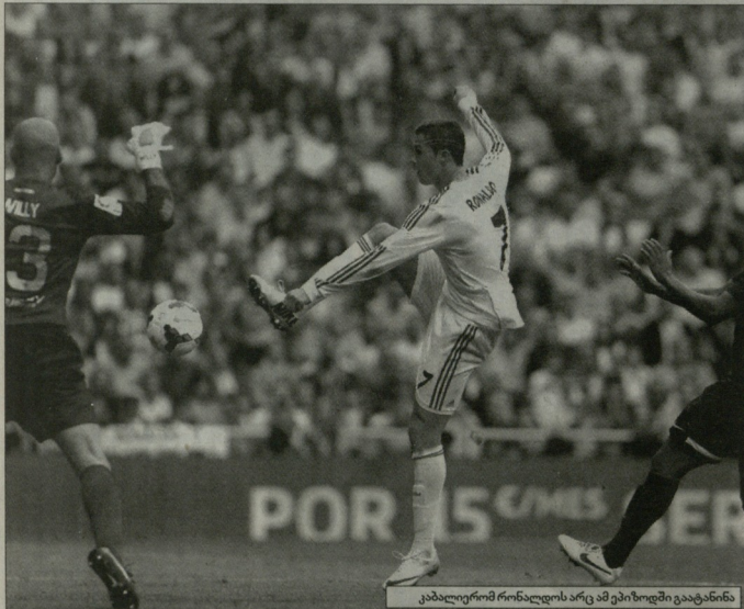
კაბალიერი რომაელის არც ამ გუნდში გატანა

პრიზის IX ტურის საკმაოდ საინტერესო გამოდგა და მოულოდნელი შედეგებით აღინიშნა. სანამ მორიგი ტურის შესახებ ვისაუბრებდით, ჯერ ორმახას გამართულ ორ შეხვედრასზე ვთქვათ, რომელიც ტურის მიმოივლება ვერ მოხდება.