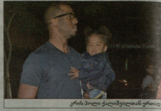
კრისი პოლი ქალმშვილთან ერთად