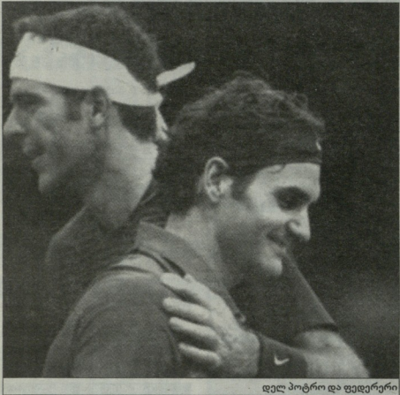
დევიდ ნალბანდიანი და ფედერერი