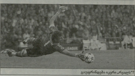
გაფურინდება იკერი "რეალს"...