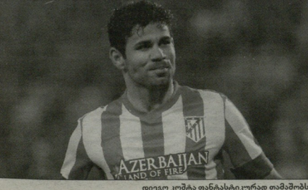
დედ ბოსკაო დიეგო კოხა გემოიანა