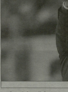
სოსტ გვარდოლა მჭირი მჭირი და კიდევ უნდა მოუფალოს...

როგორ დავაგრძელოთ მშენებლობა? როგორ დავაგრძელოთ მშენებლობა?