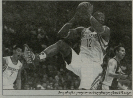
პოკარდა ყოფილი თანაკურსლებთან ნაგაო