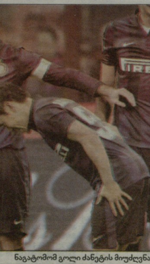
ნავბტობი გოლ ძაბნების მობდუნა