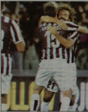
ივეტესტი საპლის აფელად გახსნობდა