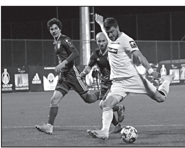
ჯეგბას მოუყარა თავი.

საბოლოოდ, საბურთალომ მატჩი გამარჯვებამდე მიიყვანა და ზედიზედ მეორე გამარ-