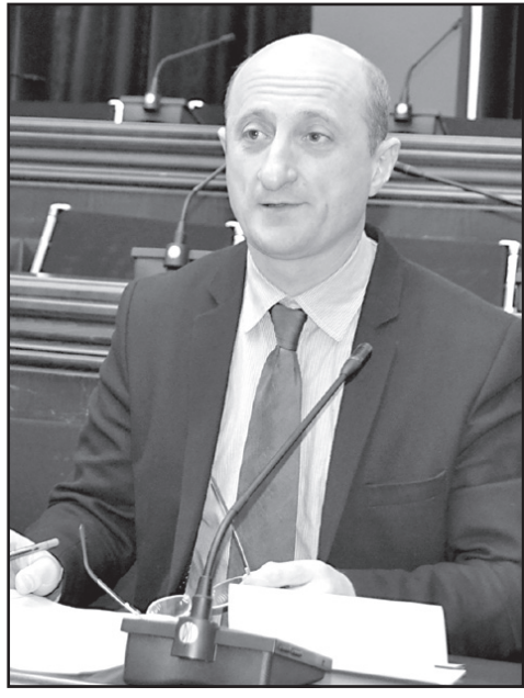
ღარიბაშვილის დაბრუნების საკითხი.

– ღარიბაშვილი ამ საქმეში მარტო ხომ არ იქნება. ღარიბაშვილი იქნება ბიძინა ივანიშვილთან და „ოცნების“ სხვა ლიდერებთან ერთად, პარტიის გენერალური მდივანი იქნება, აღმასრულებელი მდივანი თუ სხვა. ვფიქრობ, არსებულმა მოცემულობამ დღის წესრიგში დააყენა ირაკლი