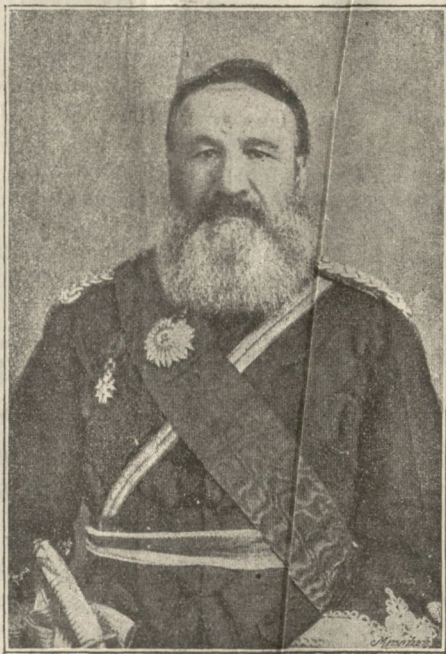
Главнокомандующій трансваальской арміею генералъ Жуберъ.

Вчера, 29-го октября, въ 10 час. утра, въ городскомъ по воинской повинности присутствіи приведены были къ присягѣ новобранцы текущаго года. Явилось около 130 человекъ, вмѣсто 194. Новобранцы приводились къ присягѣ по ихъ исповѣданіямъ. Послѣ привода къ присягѣ русскихъ и грузинъ православнымъ священникомъ, въ таковой приведеніи были армяне, католики, мусульмане и евреи, причемъ армяно-григоріанскій священникъ Самоэльянъ, несмотря на извѣстный циркуляръ