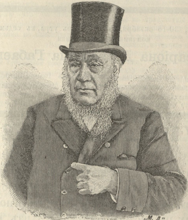
Пауль Крюгеръ, президентъ южно-африканской республики, Трансваала.