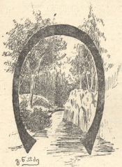
გ. ნ. ბ.