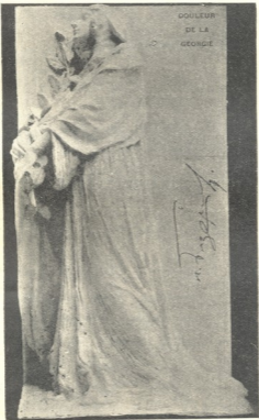
ილიას ძეგლი. — მწუხარე საქართველო. — ქანდ. ი. ნიკოლაძისა.