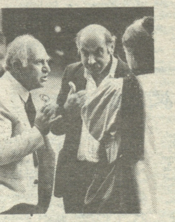
მხარს ვუჭერთ კანდიდატებს...