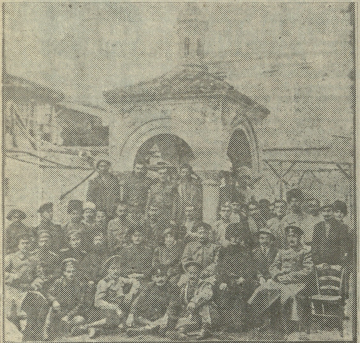
ტრაპიზონში წ. ბარბაქაძის პანაშვილის გადახდის შემდეგ (ახალგაზრდა ივერის საფლავთან).

8 ნოემბერს გაიმართა იმერეთის მეფის, სოლომონ II ნეშის ჩამოსახვენიტელი საორგანიზაციო კომისიის საგანგებო სხდომა, რომელზეც აღინიშნა, რომ პრაქტიკულად ყველა საორგანიზაციო საქმე დამთავრებულია. ზუსტი ინფორმაცია ცერემონიალის შესახებ თურქეთის ხელისუფალთა ხათანადო ვიზის მიღების შემდეგ უახლოეს დღეებში პრესით, ტელევიზიითა და რადიოთი ეცნობება საზოგადოებრივად.