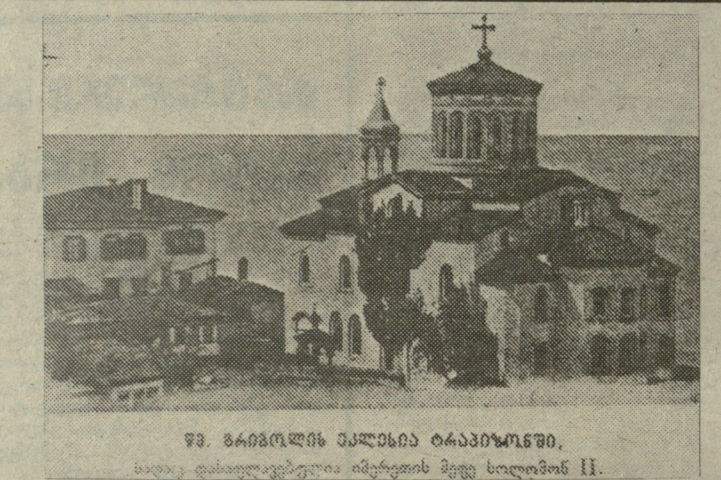
წ. ბარბაქაძის პანაშვილი ტრაპიზონში, ახალგაზრდა ივერის მეფე სოლომონ II.