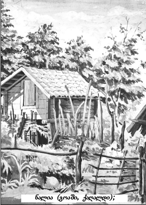
ხალია (გოში, ქაღალდი);

წერილი მესამე: „ანგარში გამოცხადდნენ ფრიდლისა და სტაჟინდაც ადმინისტრაციის ერთობა ჰედაგომბა, რომელიც ჩვენ ვასწავლის, ვარად გრიფოლამ მიხიდა, რომ შენ უკვე თამადა შეგიძლია რედაქციაში იმეშით და დამხიდა თუ გამოიხილება შენ ვეფეზეზი. და მართლაც ერთი ჰედაგომბა, რომელიც მწერლობას ეწევა, დაწერა საბეშო წიგნი, ზოგიც შეკრიბა და დაარეცა სახელად „კატა“ ეს მწერალი კნინიფილია, რომელიც ჩვენს ჰედაგომბს მხატვარ