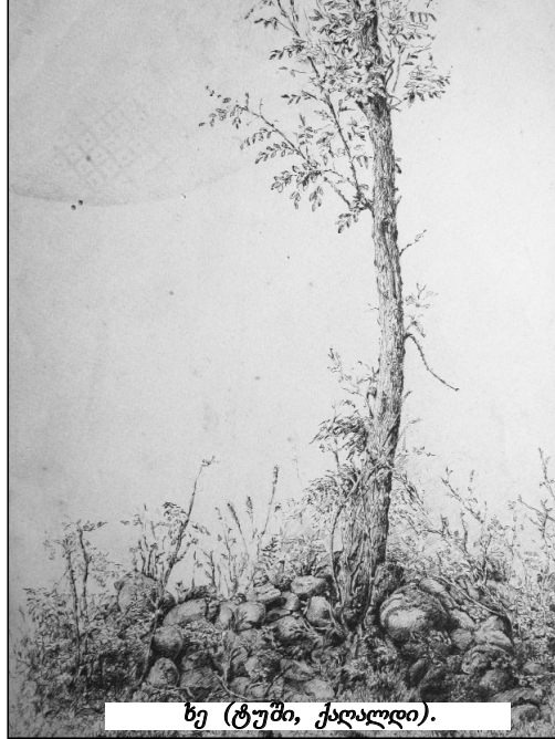
ხე (ტუში, ქაღალდი).