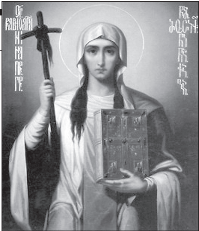
ღვთაბუნების, ერისთავის და ჯარის თანხლებით მთიანეთში (წობენში) ასულა და ნილკნელები, ფხოველები გაუქრისტიანებია...

...ქრისტიანობას, ნინოს წყალობით, მრავალი მიმდევარი გასჩენია მცხეთაში. იქ მისვლიდან მეექვსე წელს ნინომ გააქრისტიანა ქართლის დედოფალი ნანა, ხოლო შემდეგ – მეფე მირიანი და სამეფო ოჯახის ყველა წევრი. ამის შემდეგ მეფემ ნინოს რჩევით მოციქულები გაგზავნა ბიზანტიის იმპერატორ კონსტანტინესთან სამღვდლოების ჩამოსაყვანად, რათა ხალხი მოენათლათ და ეკურთხებინათ ახლად აგებული ეკლესია. ნინოს სამისიონერო მოღვაწეობა გაუგრძელებია ქართლის სამეფოს სხვა კუთხეებშიც. ის სამ-