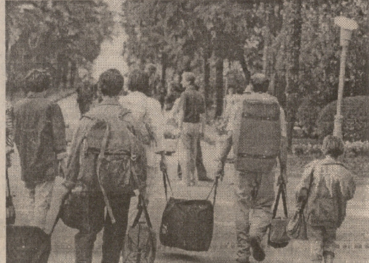
მათ უკან იწვოდა სოსუმი

ომი დამთავრდა, მაგრამ მასთან ერთად არ დაეცა წერტილი აფხაზეთის პრობლემაზე საკუთარივესა და ილუზიებით მანიპულირებას. უკვე 1993 წლის ნოემბერში, ლტოლვილებით სავსე ზუგ-