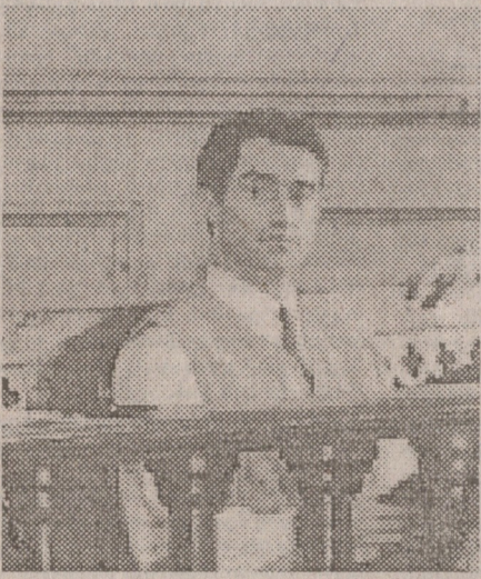
საქართველოს, რესპუბლიკის პრეზიდენტს, ბ-ნ ე. შევარდნაძეს საქართველოს რესპუბლიკის პარლამენტს