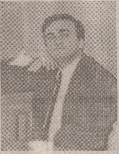
ვეერთდებით ჩვენი კოლეგების - უკრაინის, ევროპის ქვეყნების, აშშ-სა და ავსტრალიის დეპუტატების, ადამიანის უფლებათა დამცველი ორგანიზაციების, კულტურისა და მეცნიერების მოღვაწეთა მიმართვებს მოთხოვნით, გამოიხინოთ გულმოდგინება 1992-1993 წ.წ. ხელისუფლების პოლიტიკურ მოწინააღმდეგეთა მიმართ.