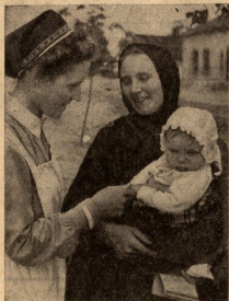
4. ეს ბავშვი გადმოცდილი დროს დაიბადა. იწითელი გერმანია და გულმოდგინე მზრუნველობის მის ჯან-მრთელობაზე.

ეს სურათები გადმოგვცემენ ბესარაზიიდან გადმოსული გერმა-ნული დედებისა და ბავშვების ცხოვრებას. იმინი ნათლად გა-მომხატავენ იმ გულმოდგინე მზრუნველობას, რომელსაც წაკო-ნაწლ-სოციალისტური გერმანია იქნს დედისა და ბავშვის მი-მართ. დედობა გერმანიაში ყველაზე სახატო და სამაყო-მოვალეობაა.