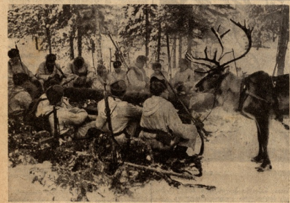
ჩადილეთის ფრინველ. შესვენება