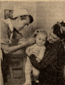
5. სადაც კი საჭიროა დამხარება — იქ არის მოწყობილი და.