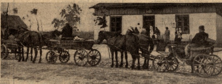
2. თვეში ერთდელ უდღადა სახლის წინ ექიმი ამოწმებს გლეხი ქალების ბავშვების ჯანმრთელობას.