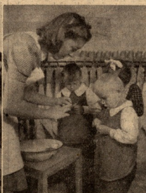
6. საბავშვო სახლებში ბავშვები იზრდებიან ლალად, სწავლობენ მზიარულ სიმღერებს, ტყვევან სი-სუფთავება და წესრიგს.