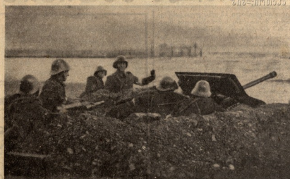
პირველივე პირველი ნომერისთვის 1957