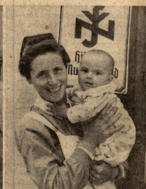
7. დედობაბაბოს წევრი ქალები გამსაკუთრებული სოციალისტი-სარგებლობენ პატარებში.