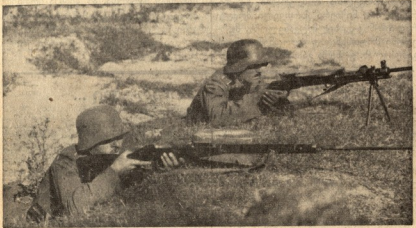
ბატონისი მისაკდინობა, ხილის ზაქიანავარკვიი აოზისიანა.