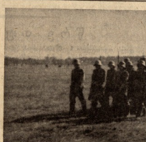
ასურელი მთის სამხედროდით

დამოუკიდებელი ახალი იაზონური სახაერო გვირი მშენებლობა, რომლის სახაერო მთლიან და მოქმედების რაიონებს მიუხედავად ღდენებულთა ტრასი. იაზონი გახდებოდა თავისებურ ახალი სახაერო გვირი ფრანკისთვის. უცხოელი კორპორაციების ახალი ეს გვირი აქტიურებს ამერიკის „ოივანს“ ტრასის სახაერო გვირებს.