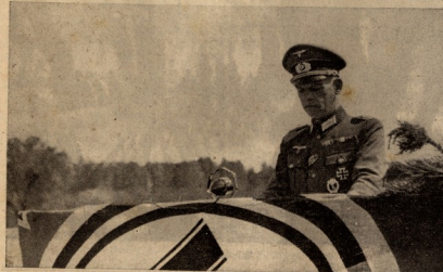
ლავროვის მეთაური არაფორაკოვსკიი ახასიახლავს მრავალ ლავროვსაბრძენს