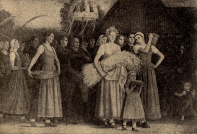
ირანის ვებენი — „ბაღლოზა უზ მონსაბლს“.