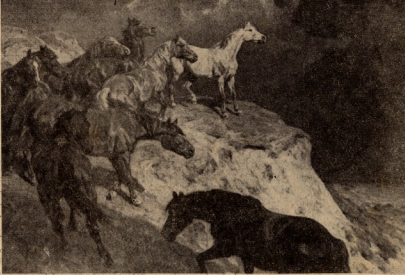
ჯოზ. როლივი — „ტავისუფლ და ბაზვებულნი“.