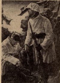
ვილ დილანი — „სამარტლო სამსახური აღმოსავლეთში“.