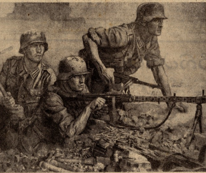
ვილელ ჯანბანი — „ხელის მტკვირფუკვებინი“.