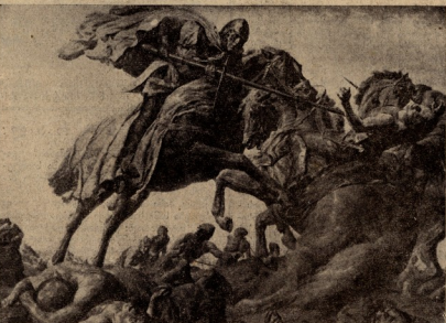
ფიგინინა ზვირნი — „ღმრთსაველთის ტავდასხმის მომდირიბა“.