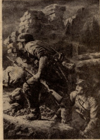
ვილ ნახი — „ბრინდლიბანი“.