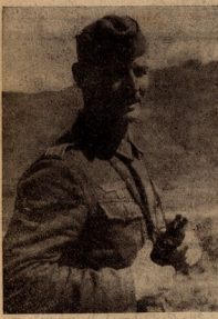
ოცნებურად შავიფა აღმართობაშიღად...