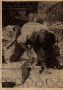
ბრძოლაშიღად სრულს ინი მხან ხრისეობის...