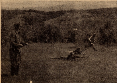
მხანან ველბაში, ოღულა და შრომაში იწრთობან მათი მიმადინეობი სრული.