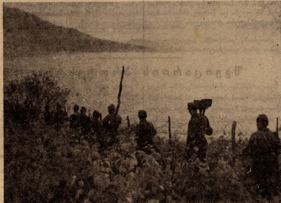
ვილით აღად, ზღვის სანაპიროში მიღინან სავსურად ქართველი მიმადინეობი...