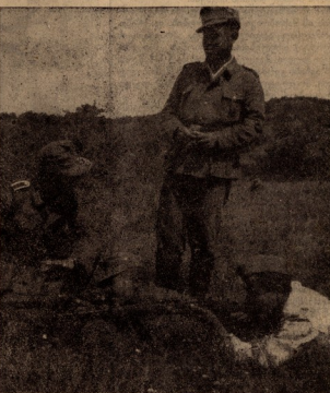
შოხანა მიმადინეობის განთავსებაში მომადინეობი. ქართველი ლაშქრონედი მხარეშიღად სრულადი...