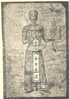
მეფე დავით აღმაშენებელი.