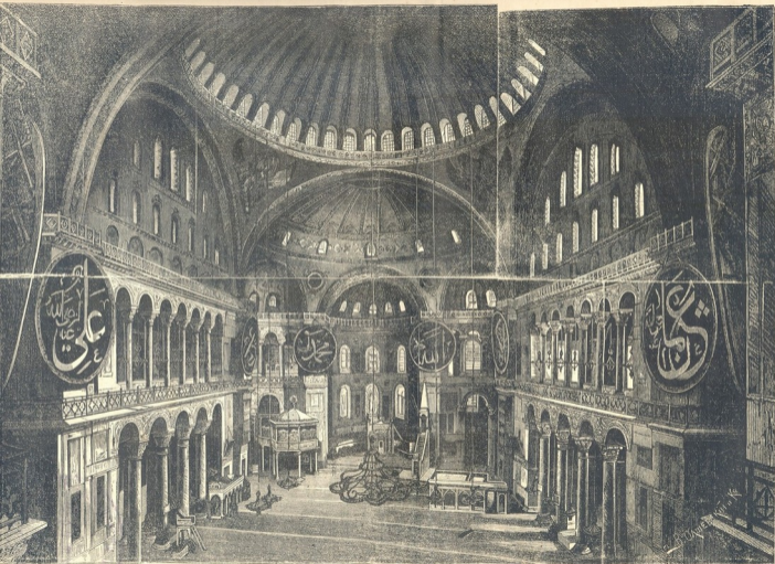
შინაგანი სახე სოფიის ტაძრისა კონსტანტინეპოლში. (იხ. «მეფე»-ს № 20).