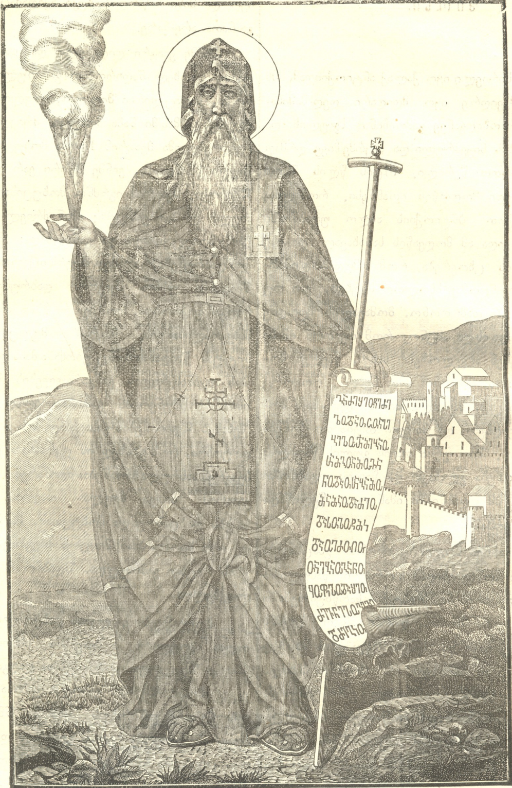
წმ. სკანდლაძის ბატონობის აღმასრულებელი