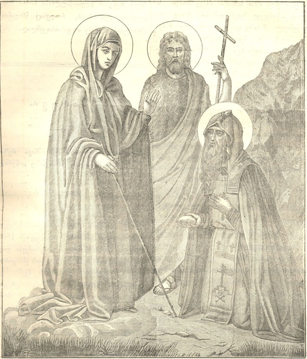
დგობის-მშობელი გამეცხადა შიას.