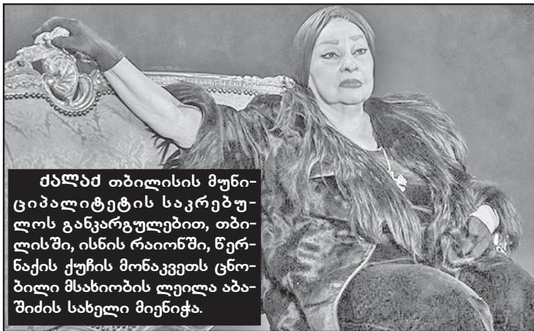
ძალბა თბილისის მუნიციპალიტეტის საკრებულოს განკარგულებით, თბილისში, ისნის რაიონში, წერნაქის ქუჩის მონაკვეთს ცნობილი მსახიობის ლეილა აბაშიძის სახელი მიენიჭა.