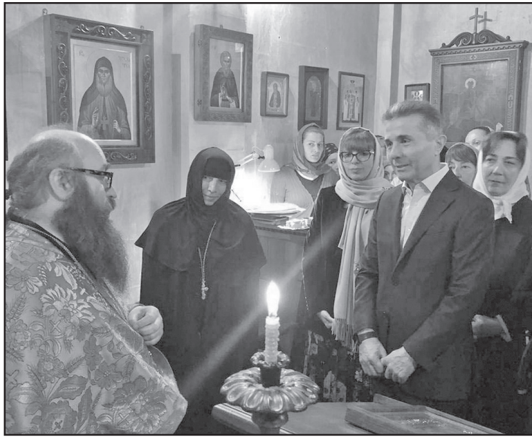
დარწმუნებული ვარ, რომ აბასთუმანი გადაიქცევა მსოფლიოში ერთ-ერთ მნიშვნელოვან ცენტრად და მნიშვნელოვან კურორტად და თითოეული ჩვენგანის-

ძალიან ბევრი რამ კეთდება მარტო ჩვენს ეპარქიაში, იქეთ აღარ ჩამოვთვლი. აბასთუმანში კეთდება კიდევ ძალიან ბევრი რამ. დაიწყო დედათა მონასტრის დამწვარი სახლისა და ძალიან ბევრი შენობის რესტავრაცია. მე