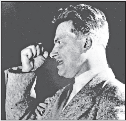
ასა აგოვდა ვლადიმერ მაიპკოვსკი