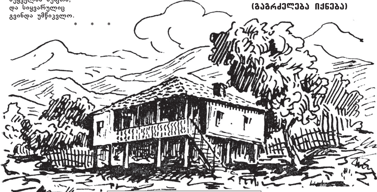
მაიპკოვსკის სახლი ბაღდათში